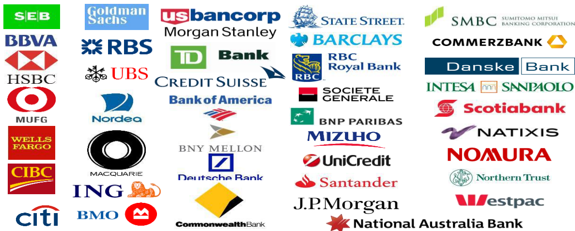
Gráfico 2: Bancos miembros del consorcio R3 – Bancos que están invirtiendo en tecnología Blockchain

• Procesos de Cumplimiento: El uso potencial del Blockchain en los procesos de cumplimiento yace en su propiedad básica de registro público de transacciones, la cual puede ayudar a automatizar procesos y reducir